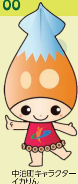
中泊町キャラクターイカリん