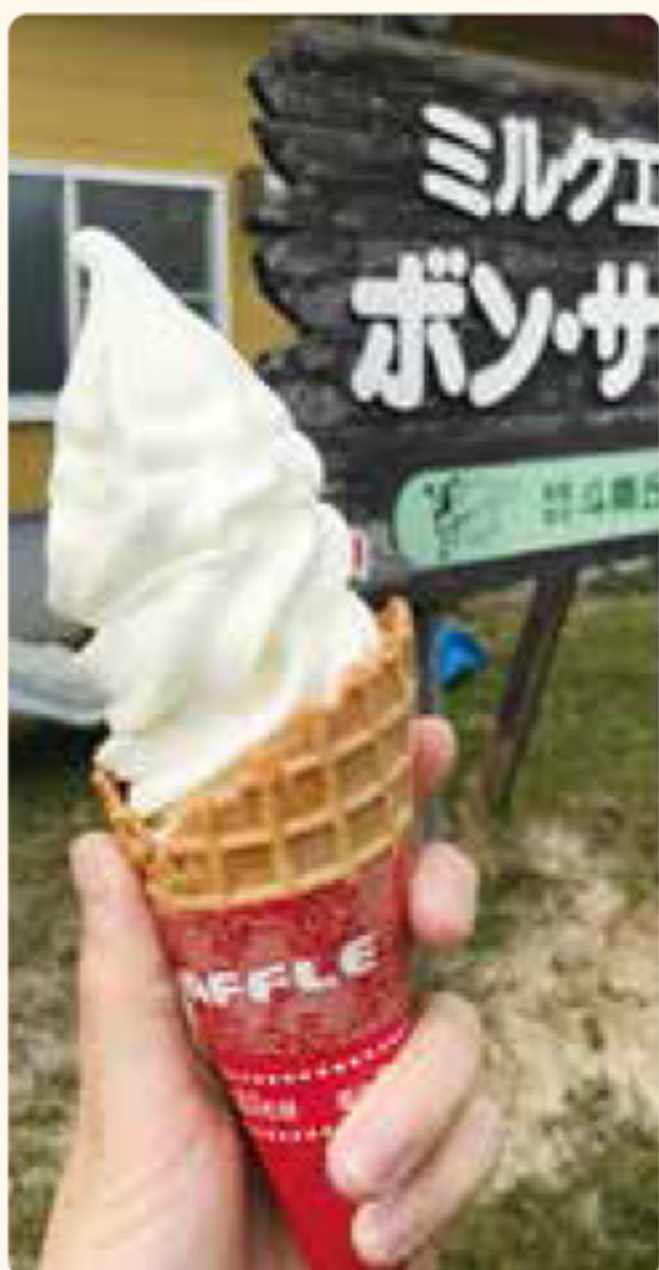
ミルク工房 ボン・サーブ (むつ市)