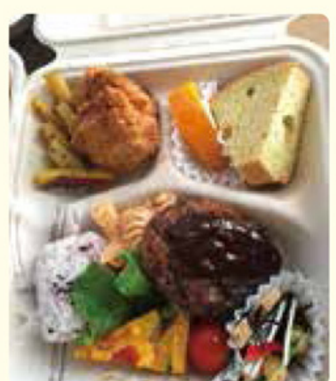
Vege cafe ちゃま