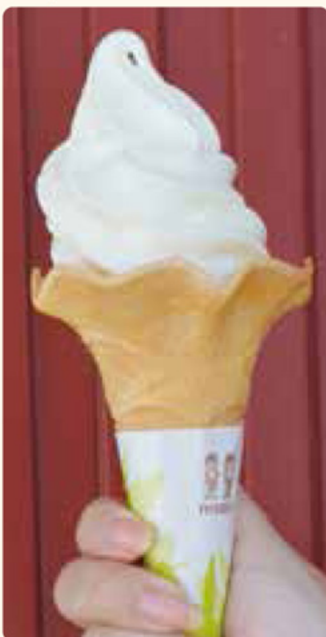
アビタニア ABITANIA ジャージーファーム (鯉ヶ沢町)