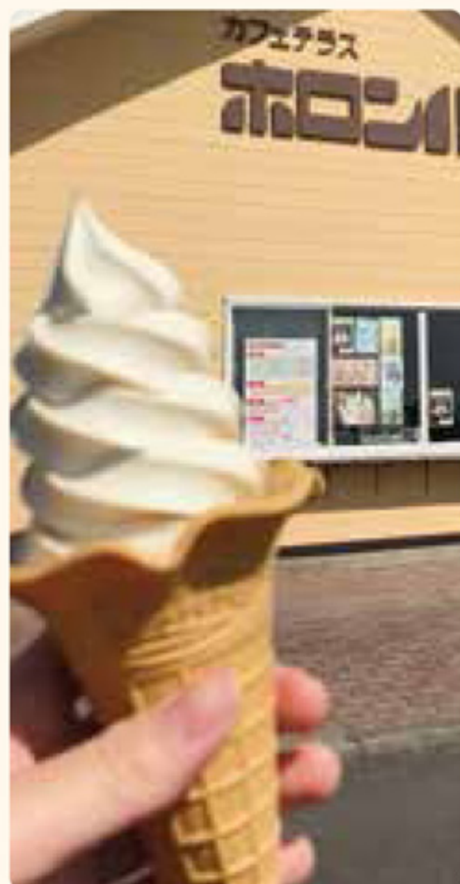
ホロンバイル (八戸市)